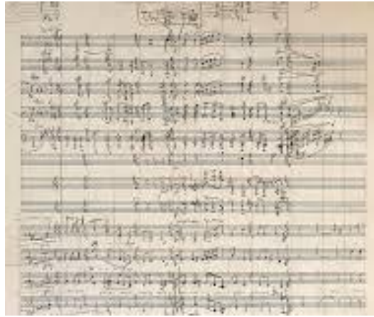
Εικόνα 2: Απόσπασμα από το Psalmus Hungaricus

Ο Kodály, σε αντίθεση με τον Bartók, δεν πίστευε ότι η παραδοσιακή μουσική ταυτίζεται με τη μουσική των χωρικών. Υποστήριζε ότι, ενώ οι χωρικοί τη μετέδιδαν και την κρατούσαν ζωντανή, στη δημιουργία αυτής της μουσικής είχαν συμβάλει όλα τα κοινωνικά στρώματα.